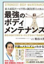
最強のボディメンテナンス