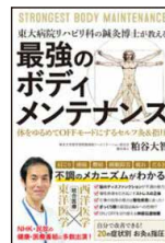
最強のボディメンテナンス